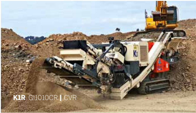
K1r GI1010CR | CVR